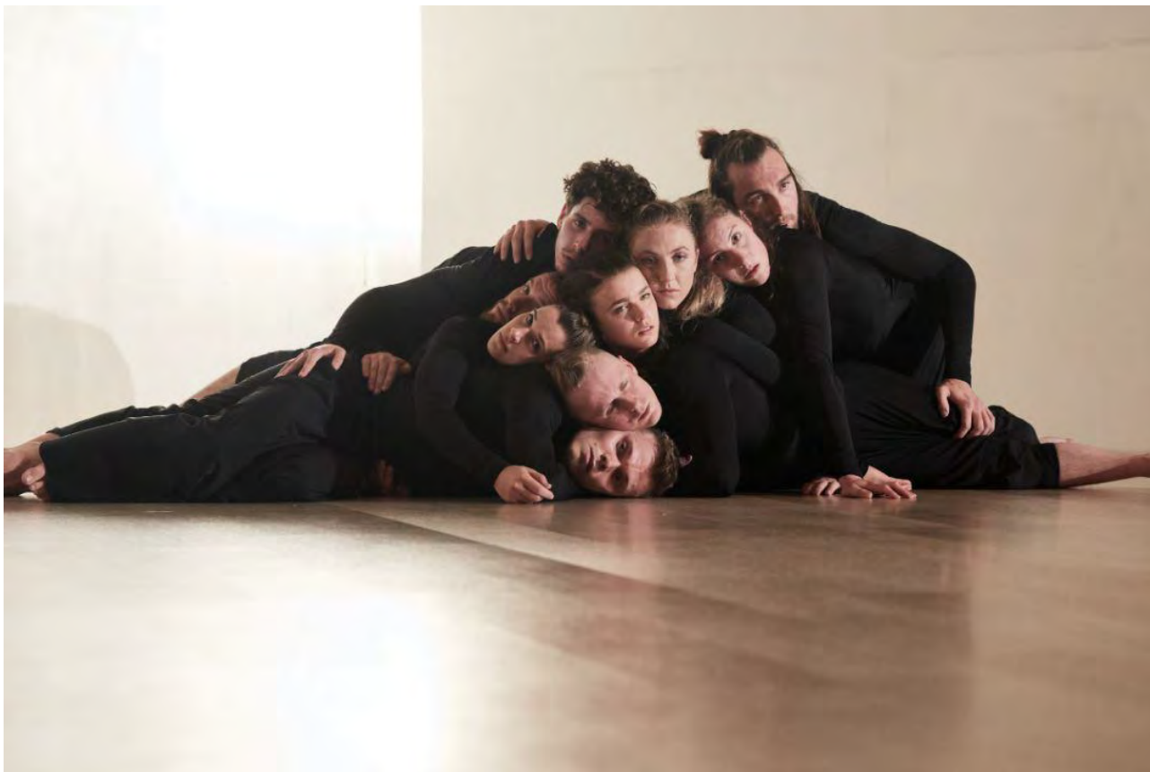
Co3 Australia 「THE_ZONE」(2017) Artistic Director: Raewyn Hill Set design: Satoshi Okada