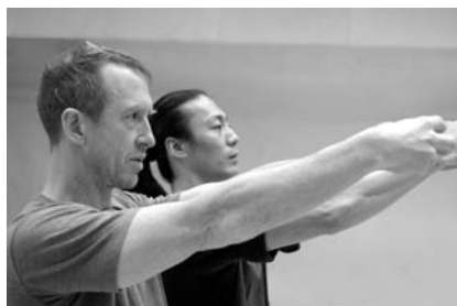
第1期目に参加した振付家のウィリアム・フォーサイス(手前左)とチベット系中国人ダンサーのサン・ジジア

以上のように、ロレックス社では研修期間終了後も、プロトジェたちのために本プログラムの効果をできるだけ拡大してゆく工夫を行っています。ロレックス社が製作する刊行物やドキュメンタリー・フィルム、ウェブサイト(www.rolexmentorprotege.com)以外にも、本プログラムやプロトジェたちに関するメディアでの報道はこの若い芸術家たちの露出をさらに高め、彼らを世界中で紹介するのに役立っています。こうした要素も彼らのキャリアへの支援につながっています。