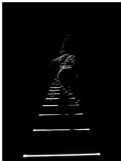
“Split Flow” 2011年11月 Van Abbemuseum (オランダ)

日本の多くの方々がシーンを改善しようという問題意識と信念を持って尽力されている。プロデューサー、制作、劇場ディレクターの方々、メディアの方々など、そういった方々がシステムを変えようと、アーティストの創作環境をできるだけ良くしようと活動されている。そういった人々がいるだけでも日本のシーンには希望がある。少なくとも僕は全く悲観していない。そういった中で僕は作る側の人間として何ができる