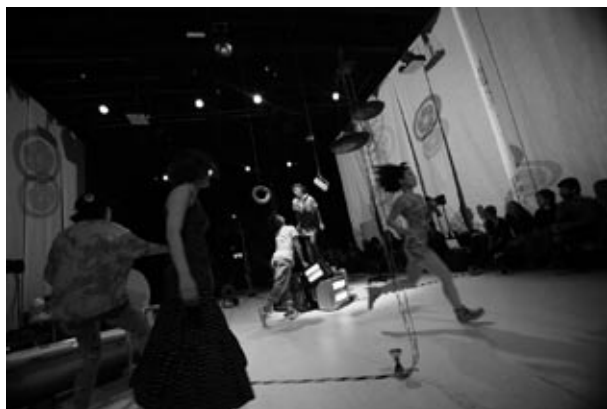
左右共：“SHIBAHAMA” 2011年9月 HAU(ドイツ)