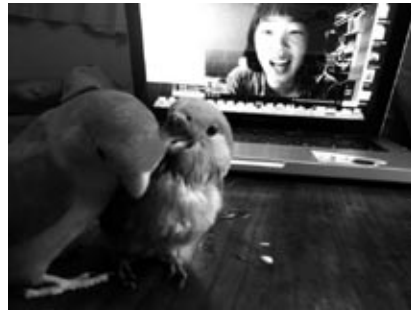
「快快」ウェブサイト： http://faifai.tv/

隣のレストランの笑い声、日陰で鳴くとかげ、大きな葉が擦れ合う。そうやって街に所有され、時には嫉妬され、理由のない衝動でしか、これから先も私はきつとうごけないんだろう。