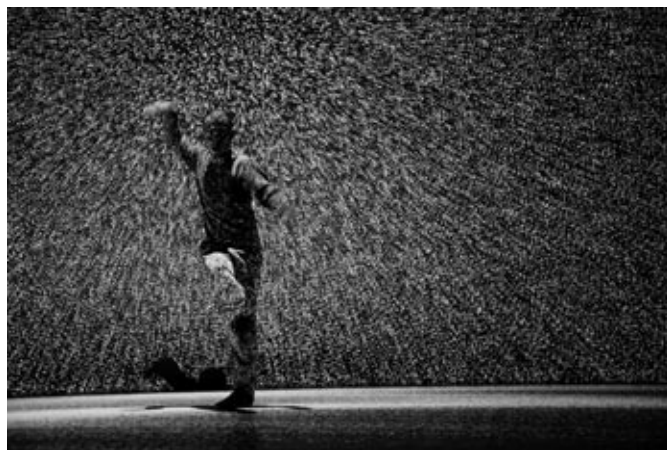
“Holistic Strata” 2011年2月

もう一つ海外で活動することで大きかったことは、僕のような作品を受け入れてくれる場所があったということを実感できたことである。活