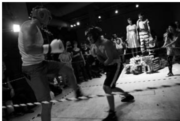
左右共：“SHIBAHAMA” 2011年9月 Merlin(ハンガリー)